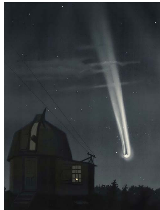
Velká kometa z roku 1881 na litografii Léopolda Trouvelota

Vydává Hvězdárna Zlín – Zlínská astronomická společnost, Lesní čtvrť III / 5443, 760 01 Zlín, www.zas.cz