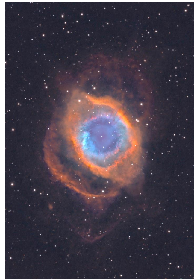
Mlhovina Helix v souhvězdí Vodnáře