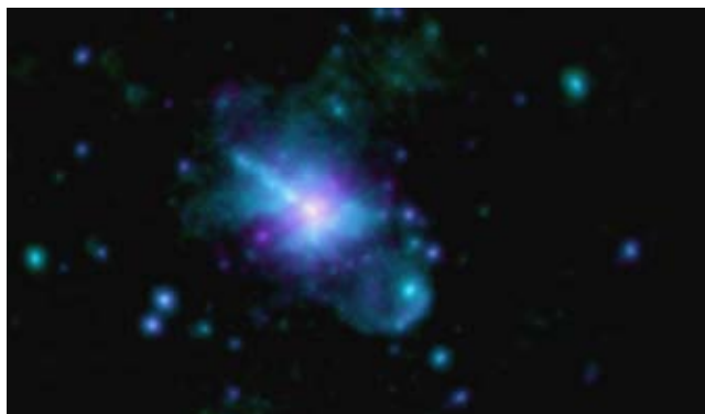
Snímek pořízený v rentgenovém oboru naopak zobrazuje nejžhavější materiál – oblaka horkého galaktického plynu o teplotě desítek milionů stupňů. Výtrysky z centra galaxie jsou patrné i zde.

Podle: http://www.esa.int/esaSC/SEM2FDEWF0H_index_0.html