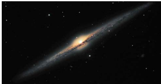
NGC 4565 Jedna z jasnějších členů (9,6 mag) 31 miliónů světelných roků vzdálené kupy galaxií Coma I a absolutní magnitudou -20,3 . S průměrem 125 000 ly je srovnatelná s naší Mléčnou dráhou.

Z našeho místa v Galaxii máme do vzdáleného vesmíru výhled jen mimo blízké struktury Mléčné dráhy. Jiné galaxie a jejich skupiny můžeme tedy vidět nejlépe tam, kam se nám na oblohu nepromítá Mléčná dráha. Obloha se nám takto nabízí na jaře a na podzim. Na jarní obloze dominují souhvězdí Panna, Lev, Vlasy Bereniky a v nadhlavníku Velká medvědice. Mezi Velkou medvědicí a Vlasy Bereničinými je ještě velmi malé a hvězdami nenápadné souhvězdí Honičích psů. A právě tudy je možno pohlédnout do skutečných vesmírných dálač na cizí galaktické ostrovy.