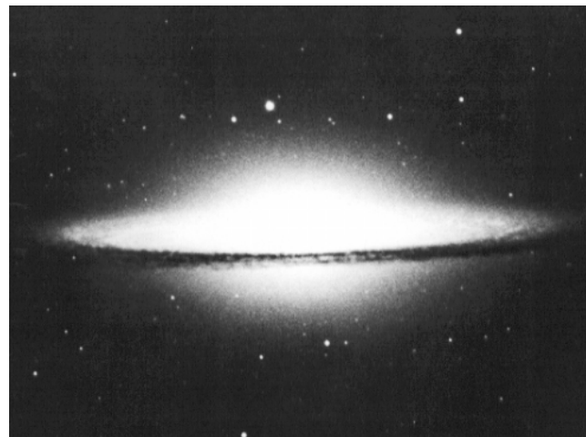
M104, NGC 4594 – Sombrero

Spirálová galaxie s tmavým prachovým pásem. Je jednou z nejjasnějších a největších galaxií v kupě Coma-Virgo, je od nás daleko 65 miliónů světelných roků.