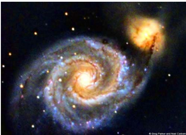
M 51 Vírová galaxie, NGC 5194

Byla objevena Messierem v roce 1773, ale spirálová podoba byla odhalena až v roce 1845, Lordem Rossem. Stala se tak první galaxií spirálového typu, která byla rozpoznána vizuálně. Patří do malé skupiny galaxií v Honičích psech. Je zde dominantním členem. Nachází se 13 miliónů světelných roků daleko a patří k jasnějším galaxiím na obloze (8,4m).