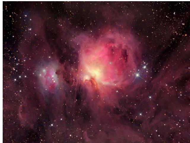
M42 Mlhovina v Orionu – snímek pořízen z Hubblova dalekohledu

Přednáška hodonínského cestovatele o zemi, o které se v poslední době hodně mluví. Přednášející je autorem knihy Írán plný mučedníků.