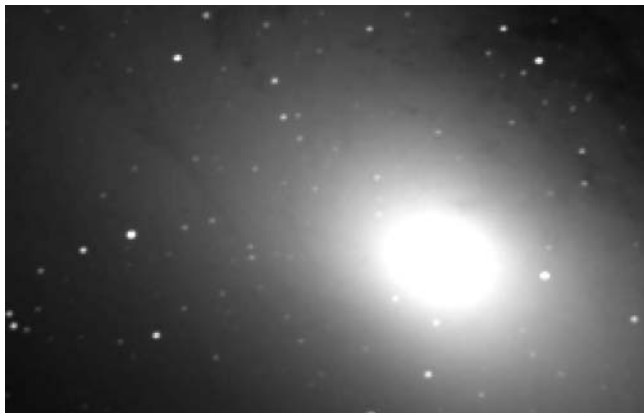
Snímek galaxie M31. Naleznete nějakou novou hvězdu?